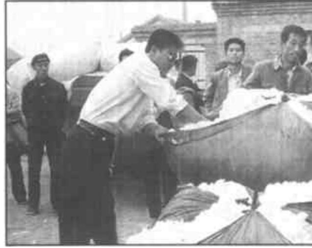
河口区棉花收购已进入高潮，为方便棉农售棉，他们在棉花种植密集区设点收购，随收购，随结算。截至目前，全区已收购籽棉50多万公斤。图为重点产区河口区刘郭站收购现场。

本报讯 10月22日至24日，全省国有企业绩效评价试点培训班在我市举行。 实施企业绩效评价是国际上的通行做法。我国建立和推行企业绩效评价制度一方面是为了与国际接轨，另一方面是为了适应社会主义市场经济体制和政府职能转变的需要。其目的是通过绩效评价，正确分析和反映国有企业经营状况，帮助企业寻找经营差距及产生原因，推进企业加强基础管理和提高经营效益，促进经营者规范经营行为，为政府对国有企业实施间接管理、加强宏观调控、制定经济政策和考核企业经营业绩提供依据。据了解，今年我省企业绩效评价试点任务，主要是检测对财政部提出的企业绩效评价制度、方法的科学性、实用性。 (记者 徐纯亮)